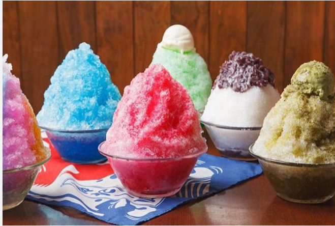
น้ำแข็งใส